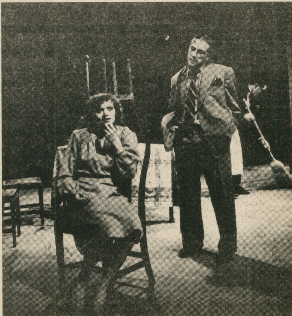
Demi-vierge romanesque et libre entrepreneur entreprenant

littéraire. « Sur ce patrimoine rasé, Brecht, ultérieurement, pourra ambitionner de trouver les moyens d'un théâtre qui ne serait plus fasciné par l'image idéaliste, ahistorique de l'éternelle individualité souffrante ; un théâtre qui ne passerait plus à côté de l'histoire. »