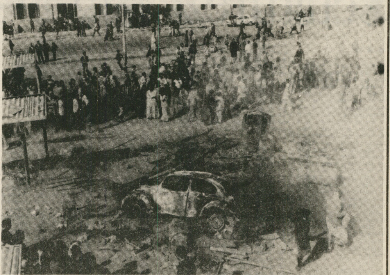
Les émeutes de janvier.

Seuls les Palestiniens, avant la colonisation sioniste, pouvaient rivaliser, en matière de combativité et de traditions d'auto-organisation, avec lui. Ce haut niveau d'activité politique et syndicale s'est traduit ces dernières années par des grèves avec occupation des locaux (contre les blocages des salaires à Helouan, en décembre 1974), des séquestrations de directeurs, des émeutes de rue enfin. Si les journées de janvier 1977 sont relativement bien connues, on ignore en revanche le plus souvent le soulèvement des ouvriers d'Al Mahalla El Kobra, en mars 1975. Pendant une nuit et une journée, 27 000 ouvriers du textile affrontèrent 6 000 soldats de la force anti-émeute pour protester contre les mesures du gouvernement Hegazi contre leur niveau de vie. Ici, comme en janvier 1977, le bilan des émeutes fut lourd : 50 ouvriers furent abattus, 200 blessés. En dépit de cette boucherie, les travailleurs égyptiens remettaient cela deux ans après, faisant vaciller, les 18 et 19 janvier 1977, le pouvoir de Sadate. Il est bien évident que l'initiative Sadate a aussi comme objectif, sinon d'étouffer la contestation ouvrière, du moins offrir un répit à la bourgeoisie égyptienne. La presse du Caire utilise un argument massif : la paix permettra de déga-