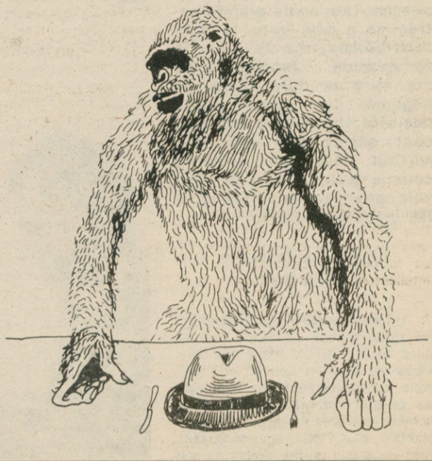
Soldat allemand revenant de la grande boucherie impérialiste