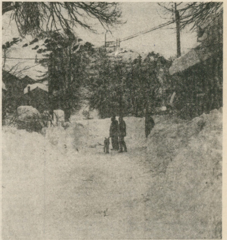
Un village isolé