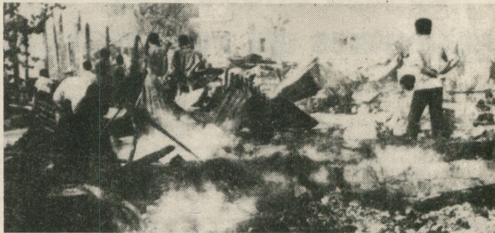
« Une partie de la commune An Phu, district Bay Nui, complètement rasée la nuit du 30 avril 1977 » Photo et légende diffusées par l'ambassade du Vietnam à Paris.

Ces dernières « révélations » sont probablement destinées à provoquer l'attention de Pékin. La direction chinoise affiche actuellement beaucoup plus ouvertement son soutien au PCK. Au lendemain de sa visite à Phnom Penh, en elle-même déjà spectaculaire, Mme Teng Ying-chao a en effet déclaré que la « juste cause » du peuple cambodgien engagé dans