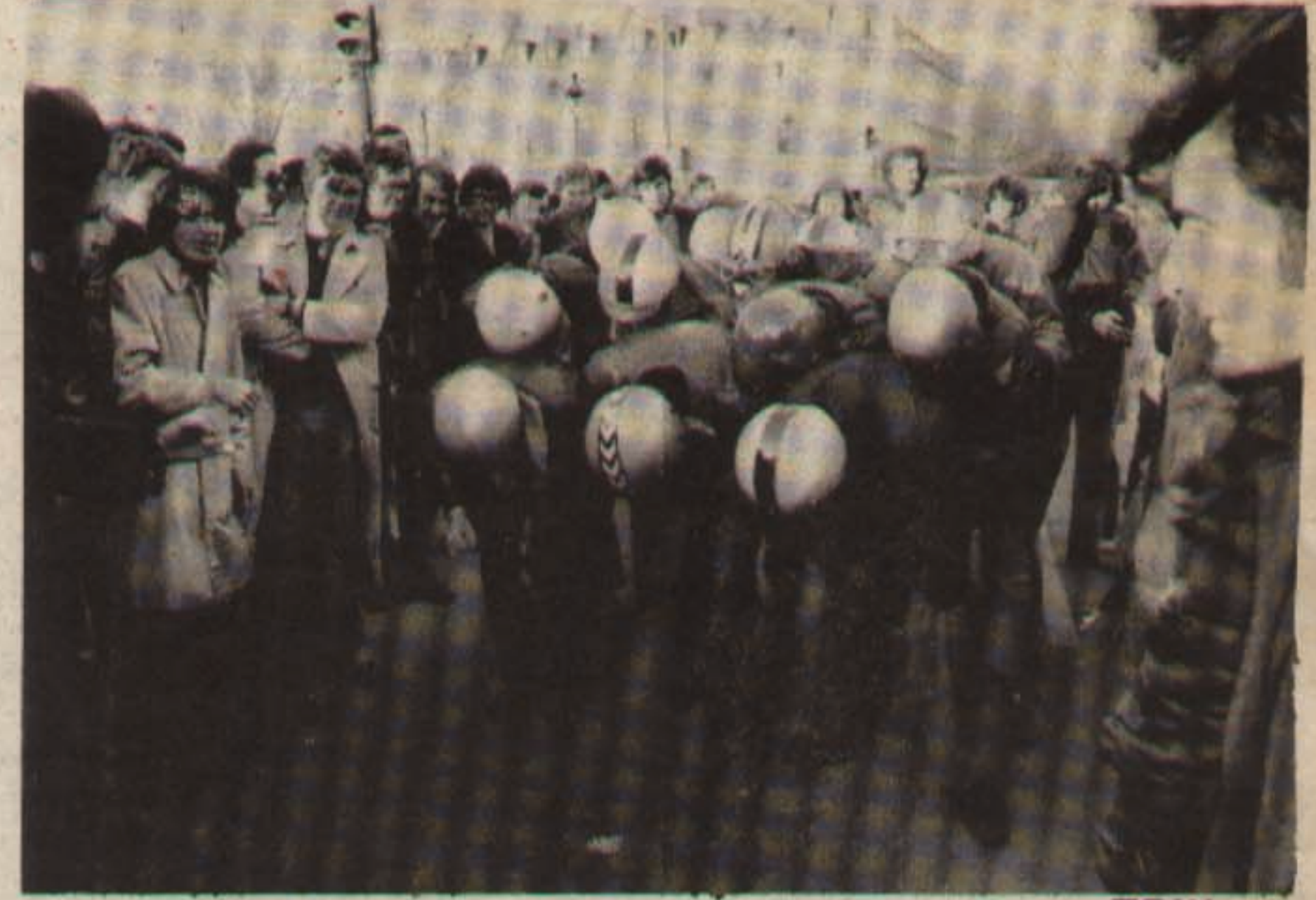
Vivre sans temps morts... Jouir sans entraves...