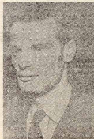
Luis Enrique Pujals, dirigeant du PRT, assassiné en septembre 71 par les réseaux fascistes argentins avec la com- plicité de la police officielle.