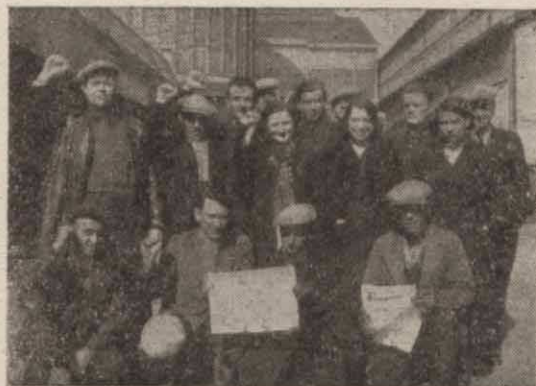
Trocello, dans un groupe de grévistes de Citroën-Epinettes (mars-avril 1937) déployant « La Commune ».